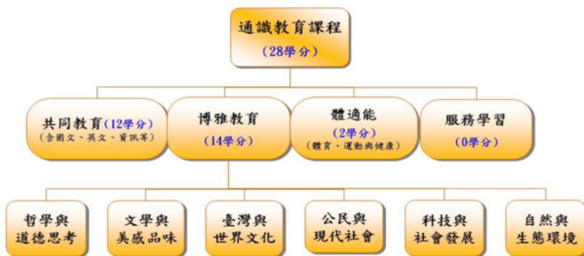
104學年度入學生通識課程架構圖