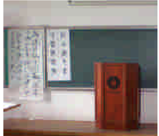
全北大學中文系的書法教室