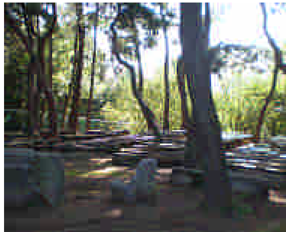
農學院寬闊的戶外教學區