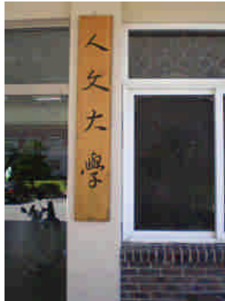
圓光大學人文學院