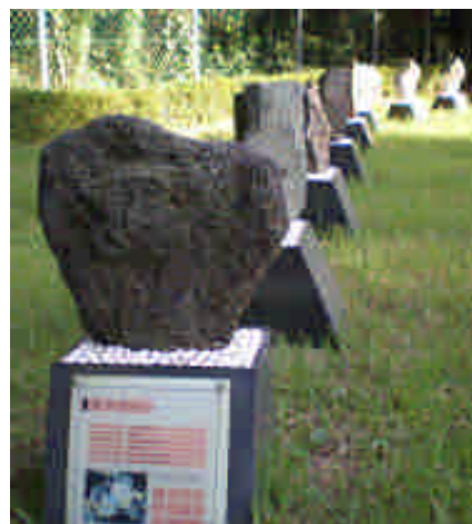
校園的石頭解說牌