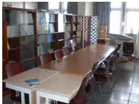
以 BK21 經費設置的研究生討論室