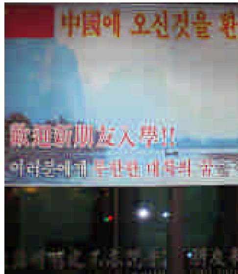
北京語學院的招生標語 「漢語時習之，不亦說乎！ 朋友來北京，不亦樂乎！」