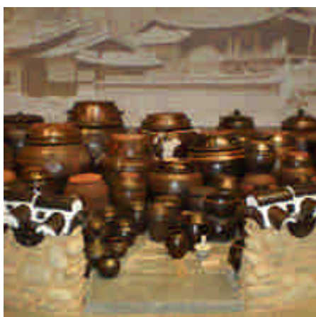
圓光大學博物館收藏豐富